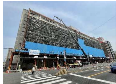
黒川住宅の耐震改修等工事

公社賃貸住宅を今後も長期にわたって有効に活用していくことに加え、建替時の再編の方向性のあり方も示した「公社賃貸住宅ストック活用計画（第三次）」に基づき、計画修繕を着実に実施するとともに、東照ビル住宅の建替え基本計画等の検討や黒川住宅の耐震改修等工事を実施した。