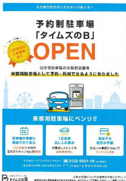
社会実験パンフレット

市営住宅の空き駐車場については、通常の契約に加え、介護者用の貸し出しや2台目募集等の特例募集を行い、契約者の獲得に努めるとともに、効果的な駐車場活用の実現に向け、令和3年度より名古屋市が一部の市営住宅において開始した駐車場空き区画活用策の社会実験の実施について協力した。