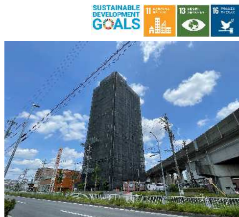
令和5年度にマンション管理組合から工事監理を受託したシティコーポ上小田井

分譲マンションの大規模修繕工事に係る設計・工事監理業務等を受託することで、建物資産の長寿命化に寄与した。また、管理組合から管理規約改正、理事会運営、長期修繕計画作成、修繕積立金不足、大規模修繕工事の進め方等、様々な相談を受ける中で信頼の獲得を図り、受託業務の拡大に努め、10件受注した。