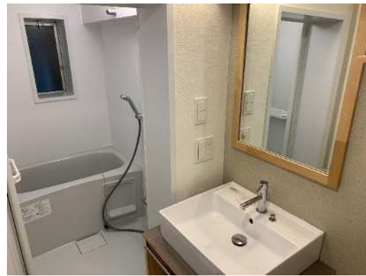
松ヶ枝住宅でのリノベーション