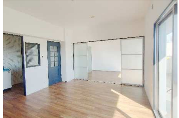
シティファミリー上社リノベーション住戸

また、定住促進住宅については、不動産仲介業者による入居者あっせんを進めるとともに、設備面等の改善を行った。