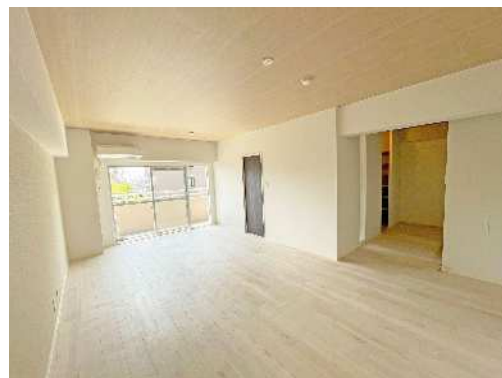
シティ・ファミリー八事リニューアル住戸

また、パノラマ写真を用いたHP情報のリニューアル、SNSによる広告宣伝の強化等、プロモーションの強化に務めた。