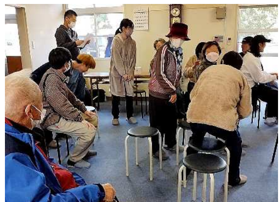
学生と入居者による交流漫オイベントの様子